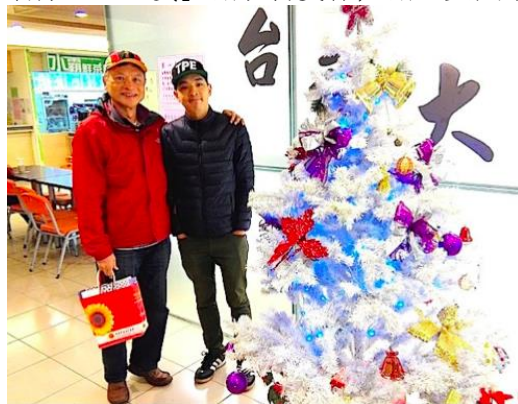
與大文攝於台北市台大