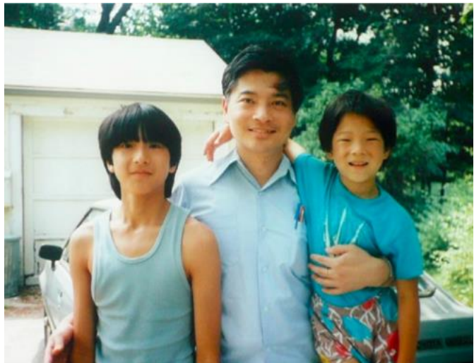
「誰最像爸爸比賽」攝影得獎作，攝於美國萊克星頓家中