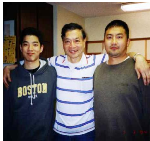
作者、母親、大兒大元、小兒大文孫兒三代同堂（攝於加州，蒙特里公園家中）