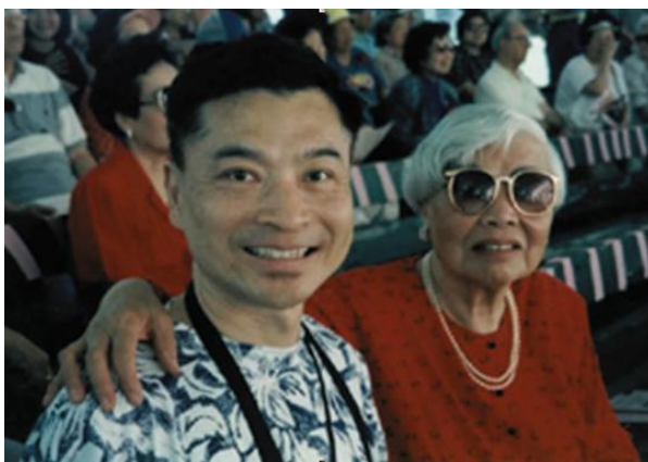
作者與母親攝於模範母親表揚會(美國 LA)