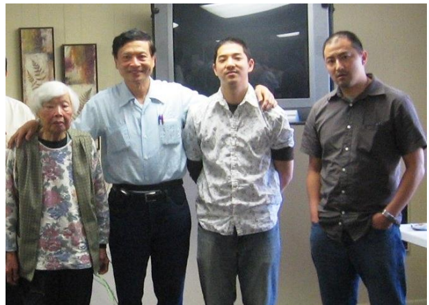
作者、母親、大兒大元、小兒大文孫兒三代同堂（攝於加州，蒙特里公園家中）